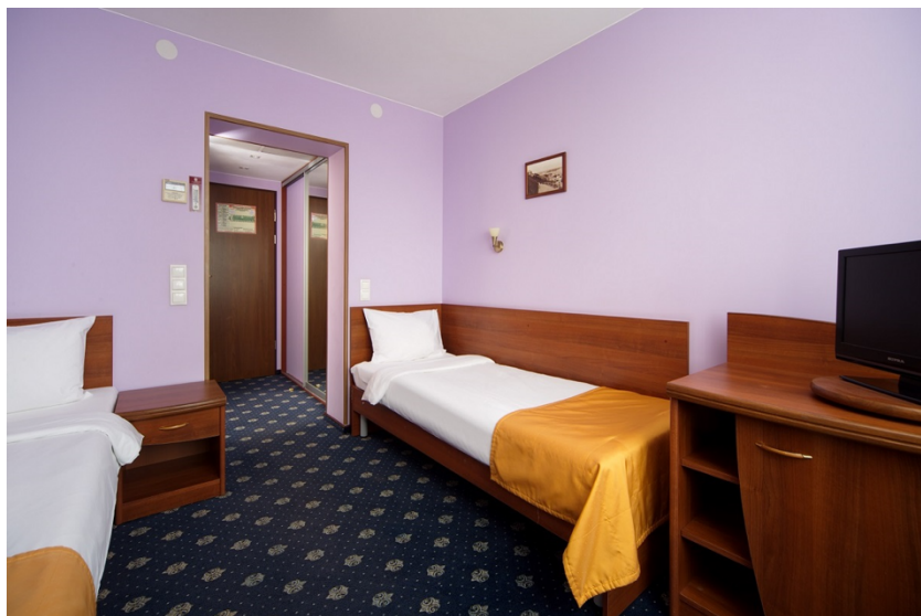
Пример номера в отеле «Азимут»