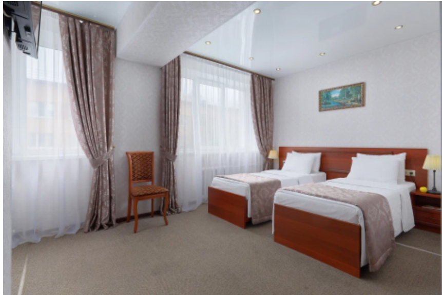
Пример номера в гостинице «Автозаводская»