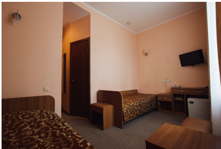
Пример номера в отеле «Матрёшка»