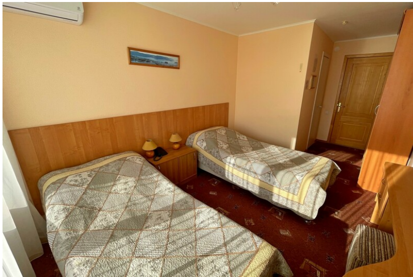
Пример номера в отеле «Россия»